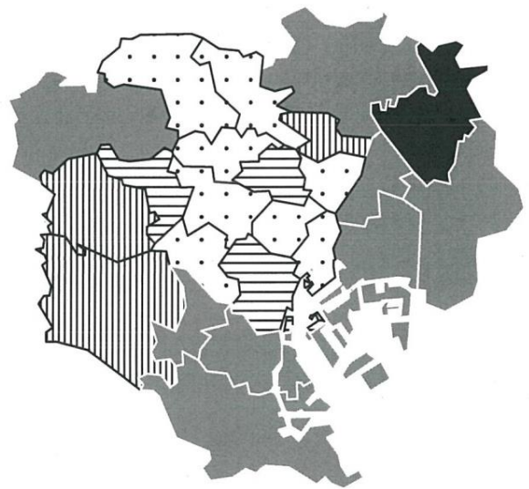
東京23区における避難所収容数の不足状況 [避難所の耐震化の現状を考慮した場合]